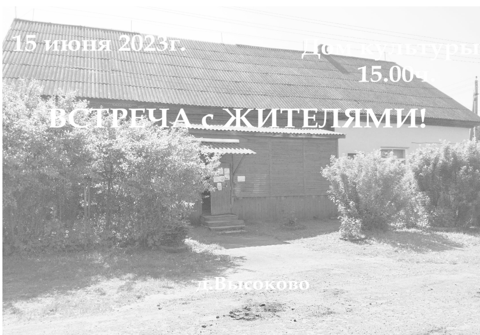
Глава Большесельского муниципального района В.А.Лубенин